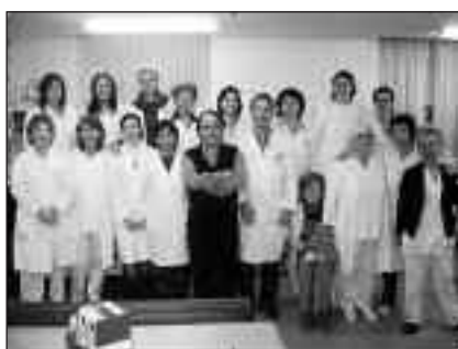
Equipo multidisciplinar de la Unidad

Complejo Hospitalario JUAN CANALEJO (A CORUÑA)